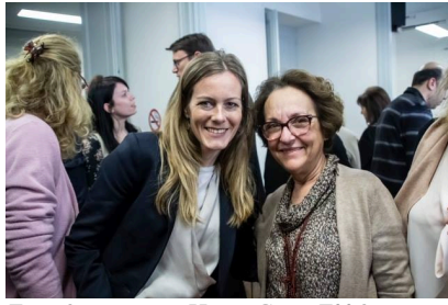
Εκπρόσωποι της Home-Start Ελλάς και της πρεσβείας της Νορβηγίας